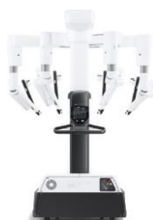
Da Vinci 5 Operationssystem