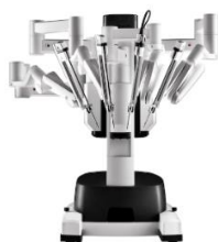
Da Vinci X Operationssystem