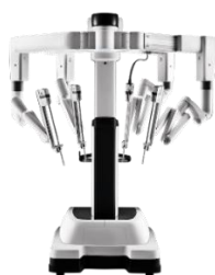
Da Vinci Xi Operationssystem

wird weltweit ein Eingriff mit einem da Vinci Operationssystem begonnen.