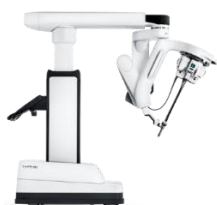
Da Vinci SP (Single Port) Operationssystem