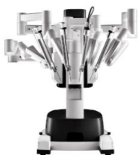
Da Vinci X Operationssystem